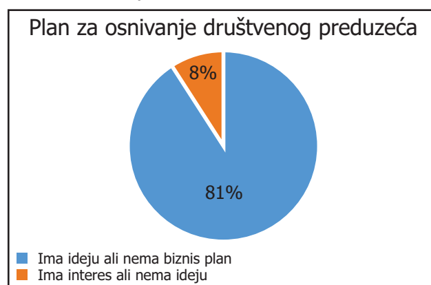
Slika 2: OCD plan za MP