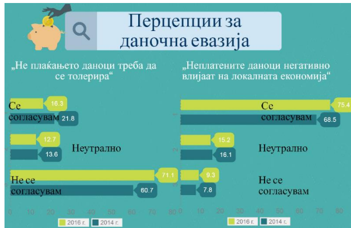
График 2 – Перцепции на даночна евазија во Македонија.

Како и повеќето од ЕУ-28 земји, Македонија применува мерки насочени кон непријавената работа и даночната евазија, кои главно се насочени кон репресивни и казни мерки , со исклучок на некои скорешни мерки за формализирање на работните места и бизнисите. Владата на РМ најпрво треба да размисли за менување на балансот помеѓу постојните казни мерки (со прогресивни стапки на казнување) и второ, на балансот помеѓу казнените мерки и стимулации . Бизнисите тврдат дека недостасуваат стимулации – поентирајќи дека ова е главната причина за сокривање на економската активност. Зајакнато со превентивни мерки, како што се зголемен и подобро насочен продор и едукативни мерки кон главните ризични групи , може да се поврати балансот во корист на зголемено формализирање на економијата.